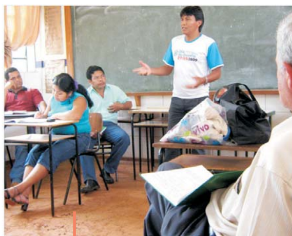
Reunião para organizar protesto contra violência nas escolas, no final de 2009