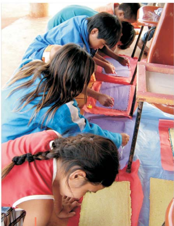
Oficina de reciclagem no CRAS da Aldeia Bororó