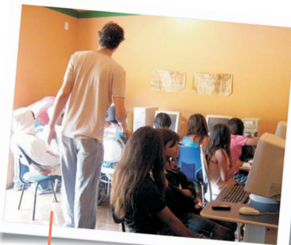
Oficina de Informática oferecida pela AJI