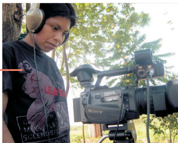
Produção de vídeo da AJI