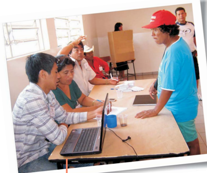
Eleição de capitães para as aldeias Jaguapiru e Bororó, em dezembro de 2009